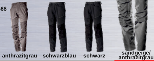
anthrazitgrau schwarzblau schwarz sandgeige/anthrazitgrau