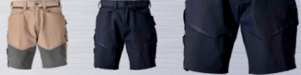
sandgeige/anthrazitgrau schwarz schwarzblau